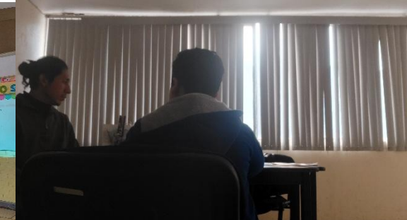
Diseño y realización de plática de intervención Hábitos digitales con infancias , dirigida a madres, padres, tutores y/o cuidadores de preescolar Juana de Asbaje . (02/dic).