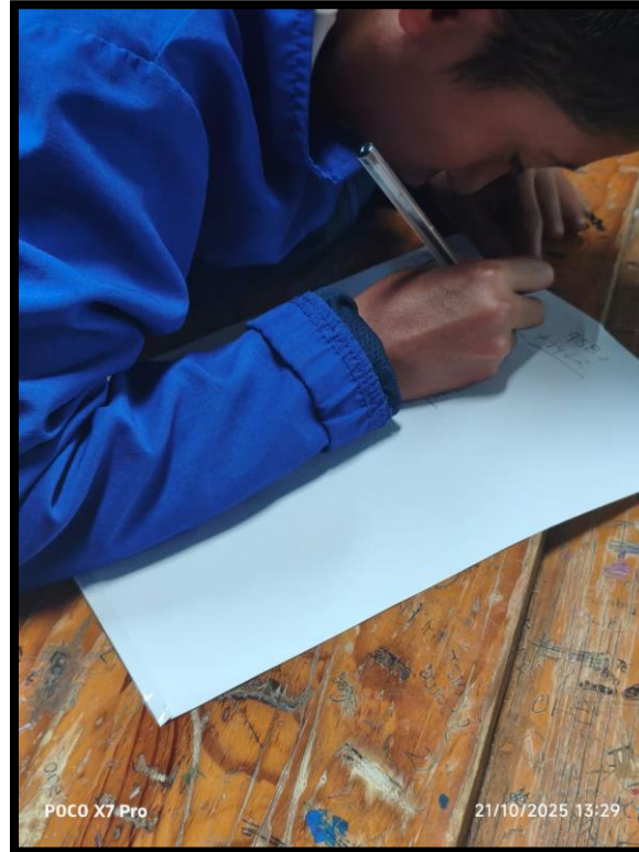
ATENCIÓN INDIVIDUAL EN SECUNDARIA NIÑOS HEROES