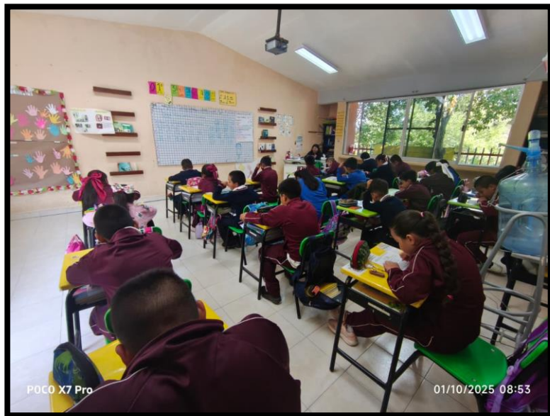
SESION GRUPAL PRIMARIA "ALFREDO V. BONFIL"