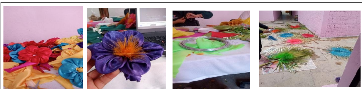
04 abril al día 11 abril 2025 se trabajó en la elaboración de flores para el set fotográfico para el huapango.