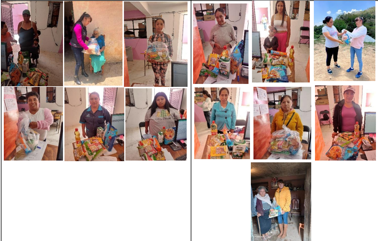
Beneficiarias de apoyo de Despensas