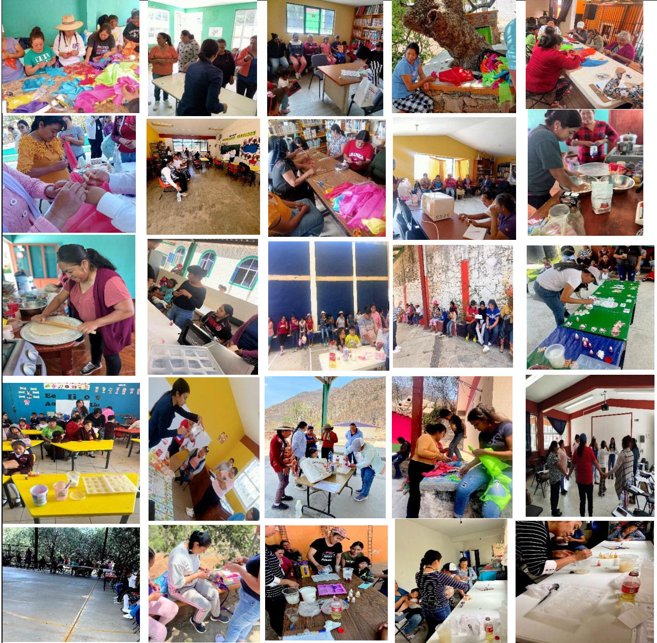
Talleres de flores en tela y limpia pipas, pizzas y jabones en las diferentes comunidades de esta cabecera