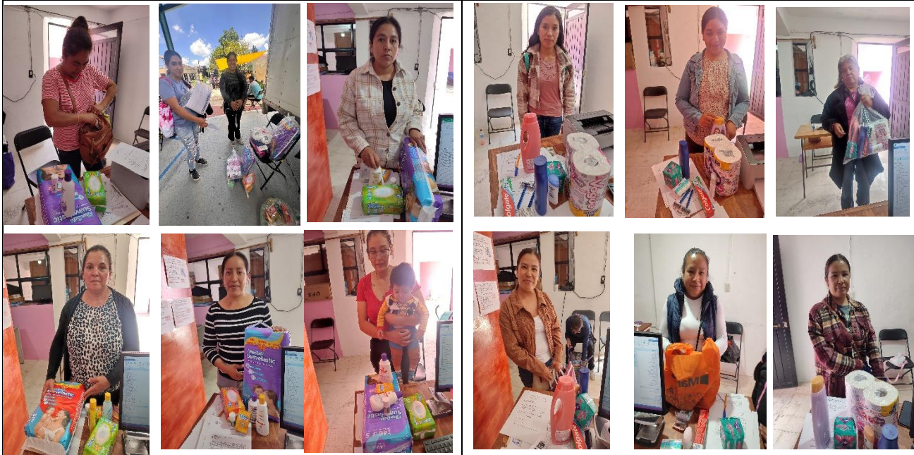
Beneficiarias de apoyo con kit de Bebés